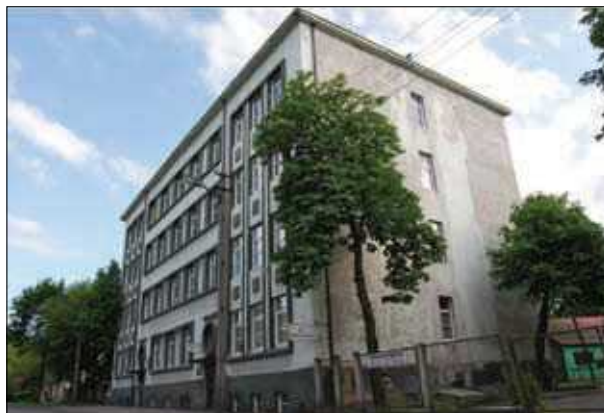
1 pav. Buvusi senelių prieglauda Kaune, Aukštaičių g. 10 (arch. K. Reisonas), 1939 m.

Žvelgdami per teorinės minties prizmę, galėtume atkreipti dėmesį, kad nei vienas iš minėtų pavyzdžių nevisiškai įkūnijo standartizacijos principus ar modernistinę bauhausinę ideologiją apie „fundamentalų pri-