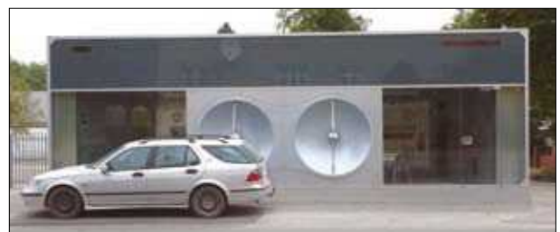
12 pav. Šviestuvų salono pastatas Klaipėdoje (archit. A. Bučas, M. Bučienė)