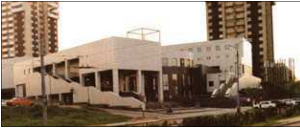
15 pav. Komeracinis kompleksas „Justė“ Vilniuje (archit. R. Perkauskas, S. Malikėnas, E. Gūzas) Fig. 15. Commercial complex “Justė” in Vilnius. Architects R. Perkauskas, S. Malikėnas, E. Gūzas

pastatyta 55 000 m 2 prekybinio ploto, antruoju jis padidintas iki 100 000 m 2 . Tai buvo lūžio taškas, pakeitęs naudotojų supratimą apie prekybą ir pramogas. Pirkimas tapo pramoga ir laisvalaikio leidimo būdu, o pramoga – preke, perkama kartu su duona kasdienine. Labai racionalus, paprastos sandaros statinys, kiek primenantis didelės kino studijos paviljoną, veikia puikiai – naudotojų-maldininkų srautai plūsta iš visos Lietuvos ir netgi užsieniečiai jį lanko kaip miesto įžymybę.