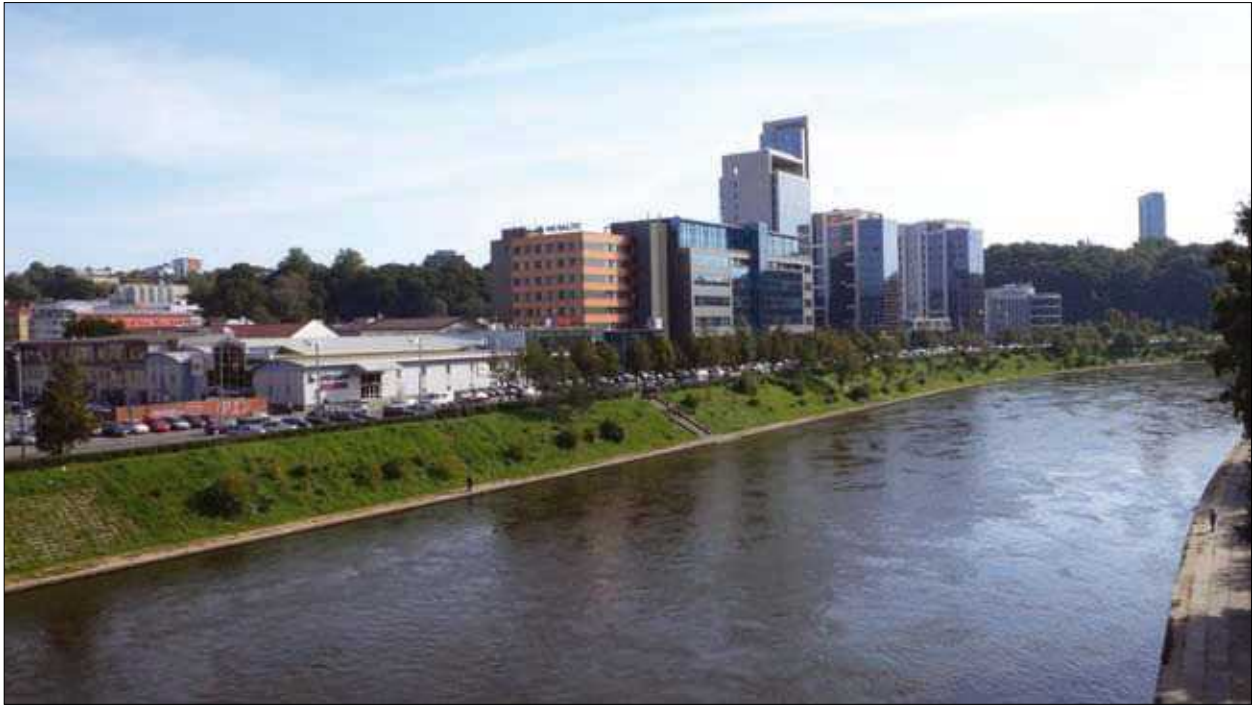
1 pav. Verslo trikampis – teritorija tarp A. Goštauto, Geležinio Vilko ir Jasinskio gatvių Vilniuje Fig. 1. Territory called “Business triangle” in Vilnius

viešasis erdves, 6 ha ploto „Verslo trikampio“ teritorija buvo prikimšta biurų pastatų, prie kurių sunku ne tik privažiuoti, bet ir prieiti (1 pav.).