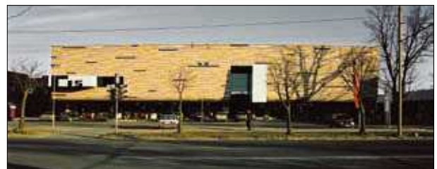
11 pav. Apdailos medžiagų salono „Iris“ pastatas Kaune (archit. A. Karalius ir kt.)

projektavimas. Tai geri pavyzdžiai saloninės , infantilios architektūros, kurios gausu šalyse, kur prekybinio ploto vienam gyventojui tenka kelis kartus daugiau negu kitur Lietuvoje. Anoniminiai architektai projektuoja ir anoniminę architektūrą, o individualų braižą ir klausą aplinkai turintys kūrėjai gali net ir provincijoje esančius prekybos pastatus sukurti įsimintinus. Tokiu galima laikyti IKI prekybos tinklo parduotuvę Marijampolėje (archit. L. Tumynienė, G. Vieversys, T. Eidukevičius, 2002 m., 9 pav.).