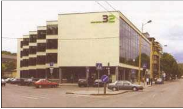
3 pav. Buvusios parduotuvės „Buitis“ pastatas Kaune (archit. V. Dičius, rekonstrukcijos archit. G. Kazakauskas) Fig. 3. „Buitis“ shop after reconstruction in Kaunas. Architects V. Dičius, G. Kazakauskas