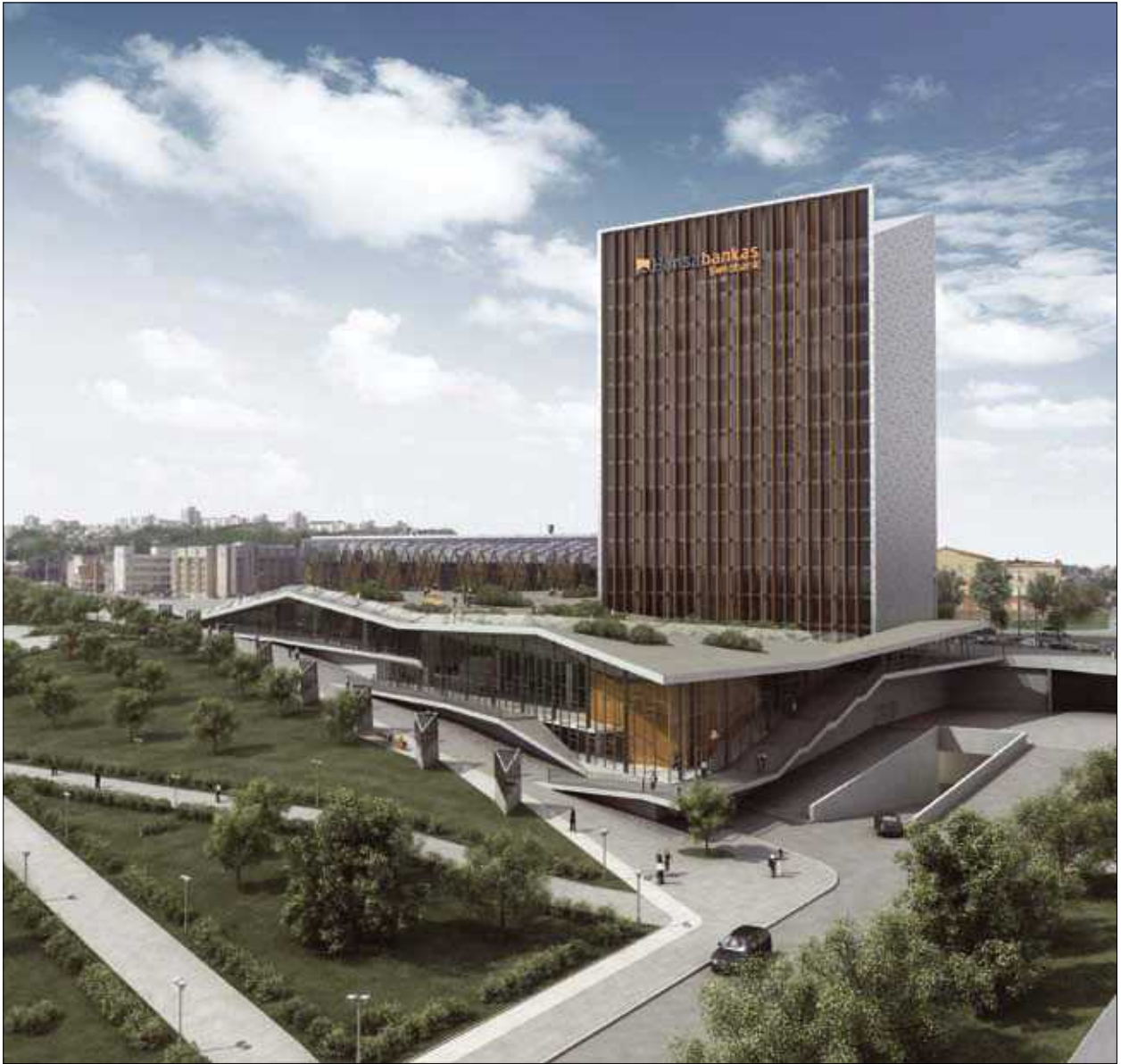
19 pav. „Hansabankas“ centrinė būstinė Vilniuje (archit. A. Ambrasas, V. Adomonytė, T. Eidukevičius, D. Malinauskas). Vizualizacija