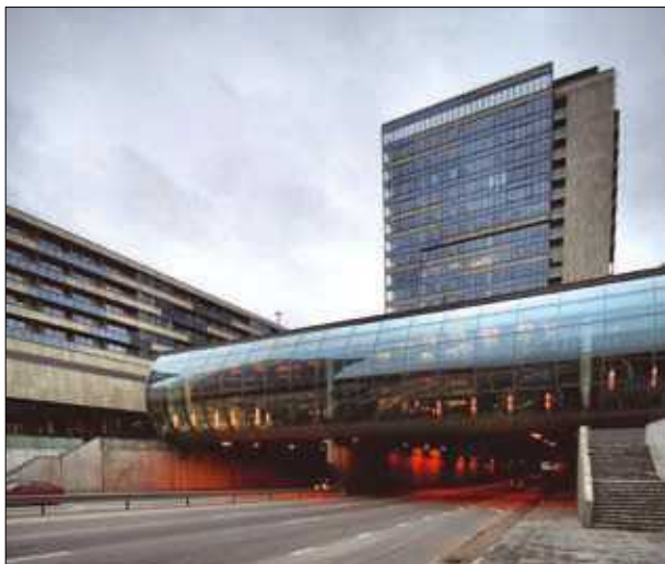
18 pav. Daugiafunkcis kompleksas „Vilniaus vartai“ (archit. R. Bimba)

Fig. 18. Multifunction complex “Vilniaus vartai”. Architect R. Bimba