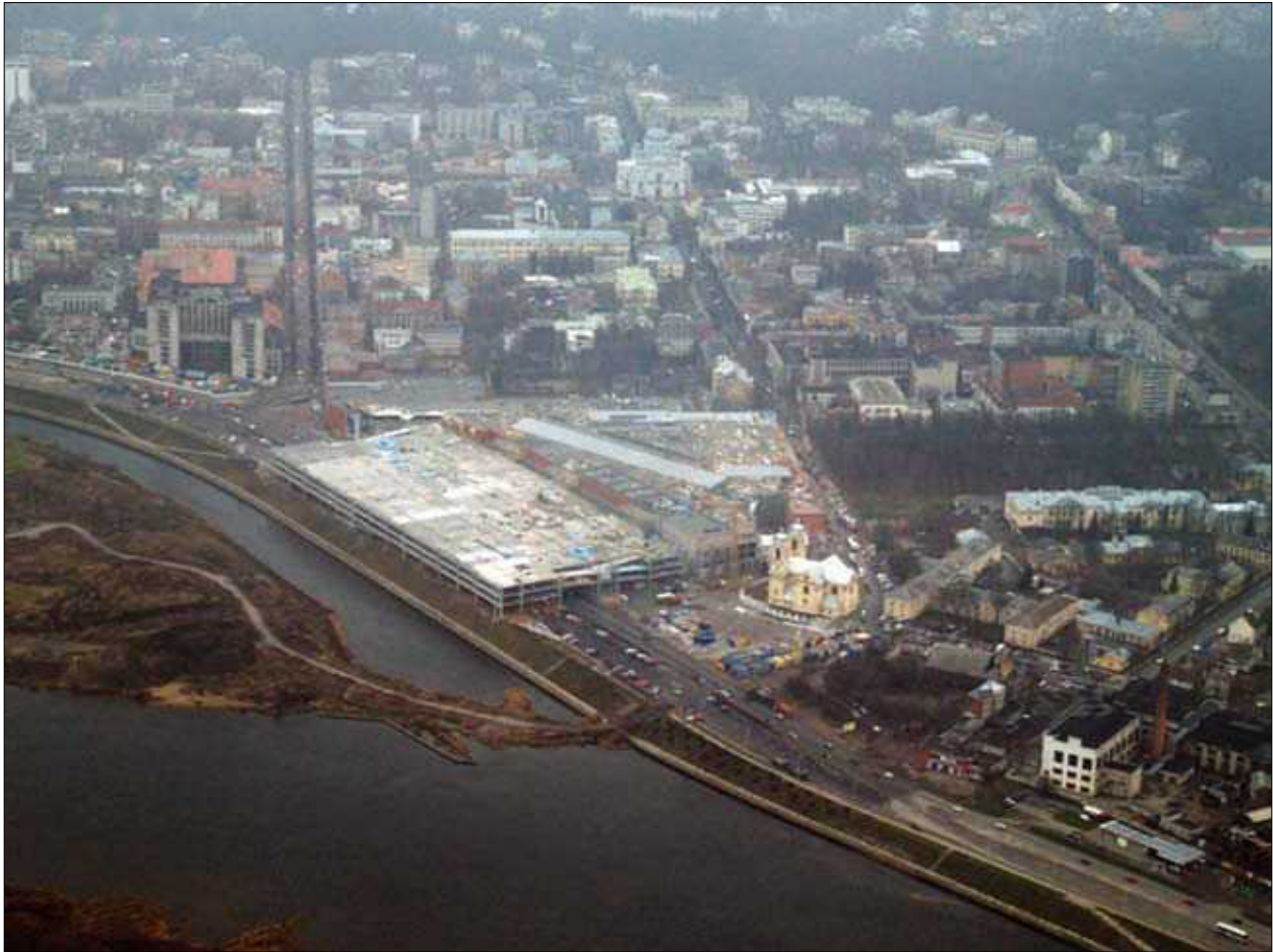
2 pav. Prekybos kompleksas „Akropolis“ Kaune (archit. G. Jurevičius, A. Kančas). Vaizdas iš paukščio skrydžio Fig. 2. Bird's eye view of "Akropolis" shopping center in Kaunas. Architects G. Jurevičius, A. Kančas

nusprendė nuimti visas reklamines iškabas mieste (Delfi 2007).