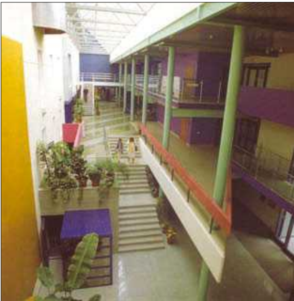
16 pav. Komplexas „Centrum“ Vilniuje (archit. K. Pempė, G. Ramunis, K. Kisielius, A. Asauskas). Interjeras

Konkreto pastato paskirtis, jo priklausymas tam tikrai tipologinei grupei, dažniausiai yra nulemtas ekonominių, naudos motyvų. Architektams ir investuotojams pirmieji Nepriklausomybės metai buvo laikotarpis, kupinas iššūkių, tuo metu buvo kuriami nauji pastatų funkciniai modeliai. Daugelis jų nebuvo realizuoti, nes,