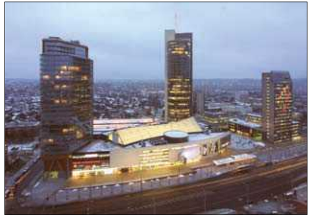
17 pav. Daugiafunkcis kompleksas naujajame Vilniaus centre Fig. 17. Multifunction complex in new centre of Vilnius