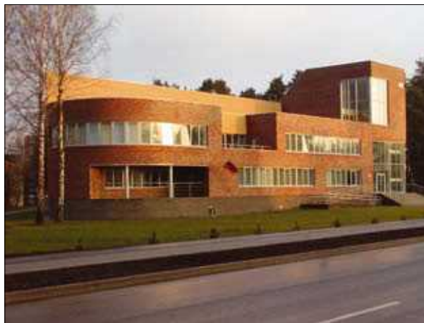
8 pav. Turto ir pajamų apdorojimo centro pastatas Druskininkuose (archit. V. Kuliešius)

Šiame kontekste geriau atrodo privačių kompanijų būstinių ir valstybinių įstaigų architektūrinė išraiška. Tam, matyt, turėjo įtakos ir tai, kad šie objektai yra konkrečios paskirties, kurios atrastą semantinį kodą galima užšifruoti architektūroje, ir tai, kad daugeliu atvejų geriausiai idėjai išrinkti skelbiami architektūriniai konkursai sulaukia daug dalyvių ir idomių darbų. Vienas pirmųjų – AB „Achema“ centrinės būstinės pastatas Kęstučio g., Žvėryne, Vilniuje (2005 m., T. Paulauskas, S. Pamerneckis, T. Mazūras, 6 pav.) – realizuotas praktiškai nenukrypstant nuo konkursinio projekto, akivaizdžiai demonstruoja turinio svarbą formai. Išryškinti svarbiausi elementai – įėjimo holas ir vadovybės antstatas, daug dėmesio skirta interjerams. Kitas reikšmingas ir ambicingas kompanijos SBA būstinės projektas (7 pav.) kol kas dar nerealizuotas. Architektūrinis konkursas vyko dviem etapais. Noras būti ryškiai matomiems nugalėjo, ir buvo pasirinktas daugiaaukščio pastato projektas, nors urbanistiniu požiūriu, matyt,