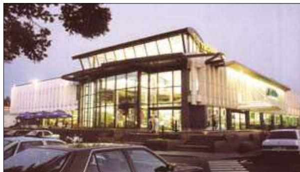
13 pav. Žirmūnų prekybos centras Vilniuje po rekonstrukcijos (archit. L. Merkinas)

„Istorijos tėkmėje vieni pastatų tipai praranda savo paskirties aktualumą, atsiranda kiti – labiau atitinkantys naujus žmonių poreikius“ (Ziberkas 2007). Laisvosios rinkos sąlygomis (palyginti su sovietmečiu) Lietuvoje labiausiai pasikeitė supratimas apie prekybos pastatų tipologiją. Prekyba visais laikais sudarė ir dabar sudaro vieną svarbiausių miesto turinio sudedamųjų dalių (Čaikauskas 2007). Sovietmečiu sunaikinta smulkių parduotuvių struktūra paskutiniaisiais okupacijos ir pirmisiais Nepriklausomybės metais pradėjo atgimti kioskelių pavidalu. Jie išsibarstė pavieniui, peraugo į konglomeratus, plėtėsi ir nyko. Vilniuje buvo statomi vienodi konteineriai , Kaune – dažnai kuriami individualūs projektai. Ilgainiui atsirado ir normalesnių parduotuvių esamų pastatų pirmuosiuose aukštuose, buvo pradėti rekonstruoti sovietmečiu statyti mikrorajonų prekybos centrai. Visiškai atsikurti ir sustiprėti smulkieji krautuvinkai, deja, nespėjo – prasidėjo didelių prekybos centrų statybos bumas (Lagunovičius 2003).