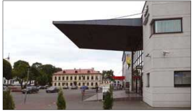
4 pav. Vilniaus banko pastatas Kėdainiuose (archit. G. Natkevičius ir kt.) Fig. 4. „Vilniaus bankas“ building in Kėdainiai. Architect G. Natkevičius

realizuotas, papuoštas grafiniu ornamentu stiklas šiam niūriam pastatui suteikia lengvumo ir elegancijos.