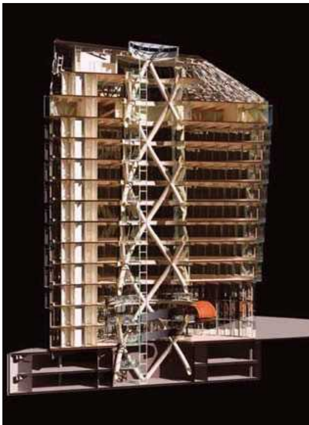
7 pav. Koncerno „SBA“ būstinė Vilniuje. PLH Arkitekter. Virtualus modelis