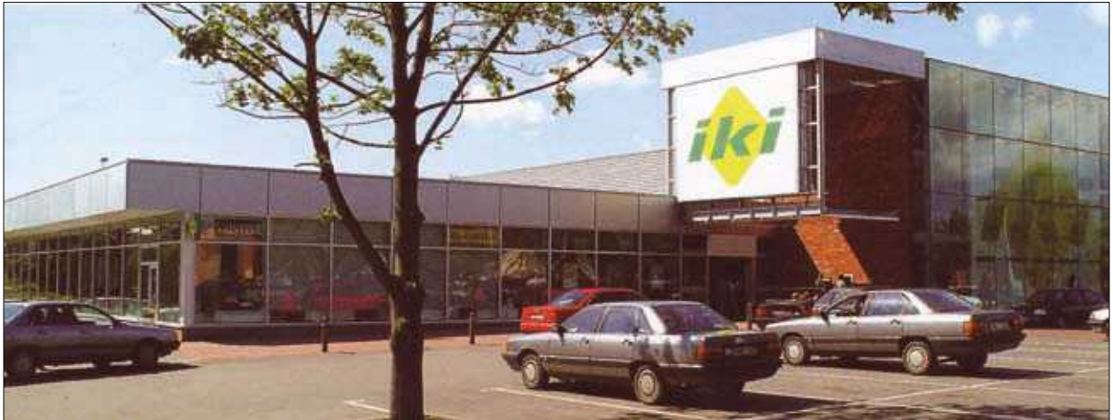
9 pav. IKI prekybos tinklo parduotuvė Marijampolėje (archit. L. Tumynienė, G. Vieversys, T. Eidukevičius) Fig. 9. IKI shop in Marijampolė. Architects L. Tumynienė, G. Vieversys, T. Eidukevičius

patalpos įsiterpė į pastatų vidų, jos prarado ankstesnį glaudų ryšį su žmonėmis, fasadai tapo tik „viešuoju adresu“ (Gehl ir kt. 2005).