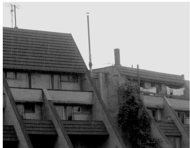
5 pav. Daugiabučiai Klausučiuose, Jurbarko r. (archit. Z. Dargis)