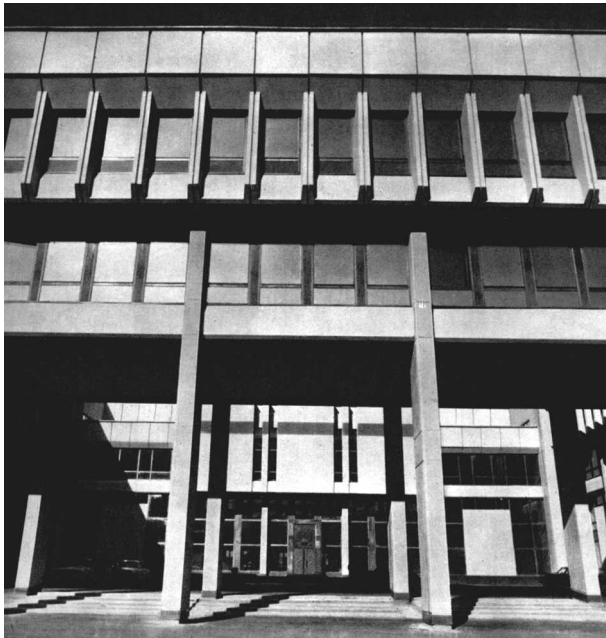
6 pav. LR Seimo rūmai (archit. A. ir V. Nasvyčiai, Robertas Stasėnas) Fig 6. LR Parliament House (arch A. ir V. Nasvyčiai, Robertas Stasėnas)

Gamtiniai elementai. Projektuojant miestus ar jų dalis taip pat buvo įgyvendinta nemaža tiek anksčiau keltų, tiek naujų aplinkos humanizavimą idėjų. Nors Lietuvos naujų miestų statybos neįgavo nei SSRS nei Vakarų Europai būdingo masto, novacijomis garsėjo Kalniečiai (1975–1983 m., suplanavimo aut. G. Miškinienė, A. Krasilnikova, A. Steponavičius) Kaune, Žirmūnai (1962–1969 m., suplanavimo aut. B. Kasperavičienė, 1968 m. – SSRS valstybinė premija) bei Lazdynai (proj. 1962–1967 m., įgyvendinimas 1967–1973 m., suplanavimo aut. Vyt. Balčiūnas, V. Brėdikis, V. Čekanauskas,