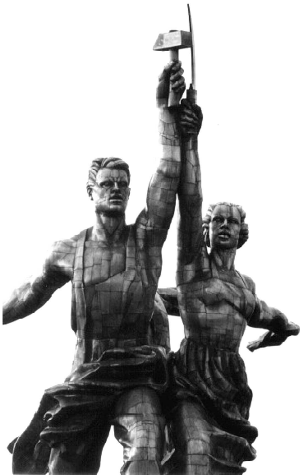
3 pav. Darbininkas ir kolūkietė ( h = 25 m, archit. B. M. Jofanas, skulpt. V. I. Muchina, 1937 m.) Fig 3. Worker and kolkhoz-maid ( h = 25 m, arch B. M. Jofanas, sculptress V. I. Muchina, 1937)

priežasčių buvo iš principo naujų idėjų poreikis. Tiek statyboje, tiek mene atsisakoma rekonstruktyvių (urbanistinių darinių rekonstrukcija, vaizduojamasis menas kaip pasaulio atspindys) sprendimų, pirmenybė teikiama dekonstrukcijai (senų urbanistinių darinių vietoje – naujieji, dailėje – koliažas, asambliažas).