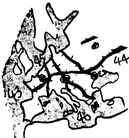
1 pav. Linijinio miesto Paryžius–Maskva schema (Le Corbusier eskizas)

Nors XX a. pirmojoje pusėje Britų salyne ryškios organiškio planavimo idėjos, Europoje vis dažniau ėmė vyruoti technokratinė planavimo doktrina. Remiantis T. Garnier ir A. Miliutino teorijomis dar 1933 m. priimta Atėnų chartija , teigusi miesto funkcinių zonavimą (pagrindinės zonos – gyvenamoji, pramonės ir poilsio – sudarančios vientisą struktūrą) [8, p. 31], pokario sąlygomis įgijo dar radikalesnį funkcionalistinį pobūdį. Miestas nebeprispažintas kaip meno kūrinys. Ėmė domi-