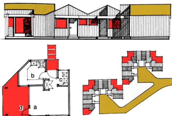
3 pav. PN-51 pensiono tipo pastato projektas. Vienos sekcijos plotas: a) bendros paskirties patalpa 12 m 2 ; b) virtuvėlė 5,1 m 2 ; c) tualetas 1,7 m 2 ; d) terasa 9,3 m 2 . Projekto autorė – V. Sakalauskaitė („Mūsų sodai“ Nr. 6(182), 1974)