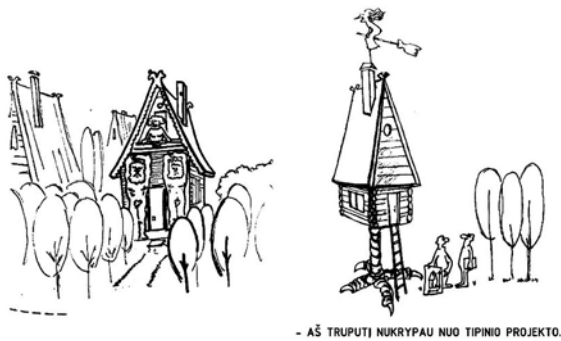
2 pav. A. Deltuvas piešinys leidinyje „Mūsų sodai“ (Nr. 10 (222), 1977)